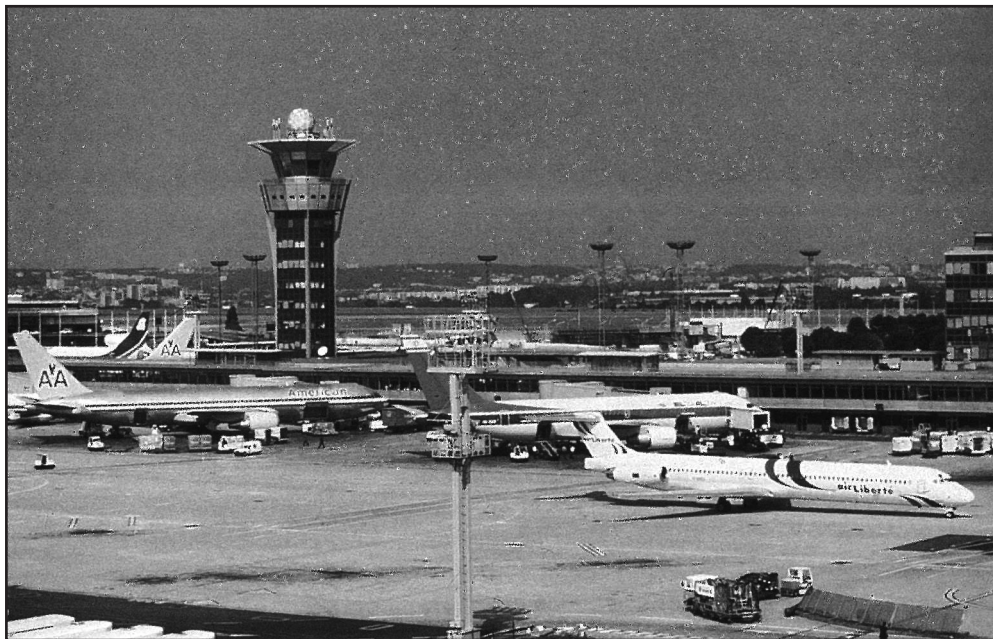
Aérogare Sud

RER C - Gare Pont d'Orly-Aéroport d'Orly Orly-Rail