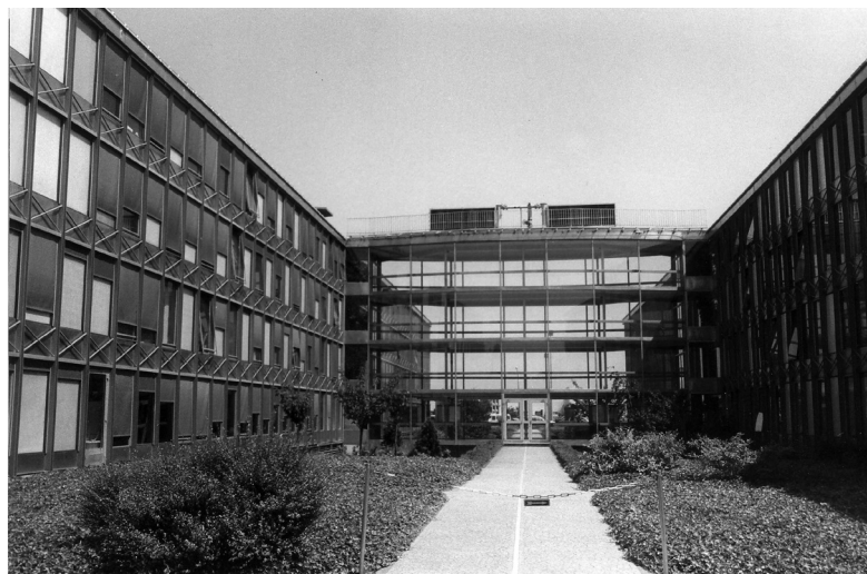
Services administratifs à l'origine d'Air France, aujourd'hui d'AOM.

Dans sa composition même, le bâtiment s'impose par la clarté du parti architectural, synthèse des idées de l'architecte sur le concept d'aéroport : séparation des circulations voyageurs et bagages, limitation des trajets voyageurs et mise en